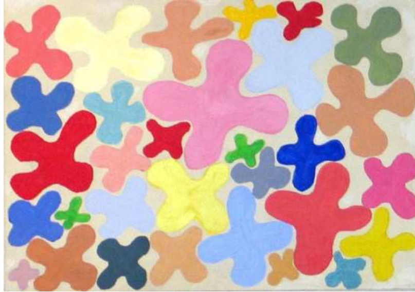
Ulla Helle: Pompidou