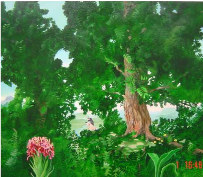
norjalainen Astrid Nondalin "Falling in love"

Ihastuksia herättivät myös mm. alla olevat suurikokoiset teokset: