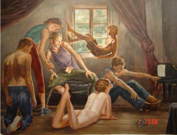
Taiteilijapari Muntean/Rosenblum'in työ