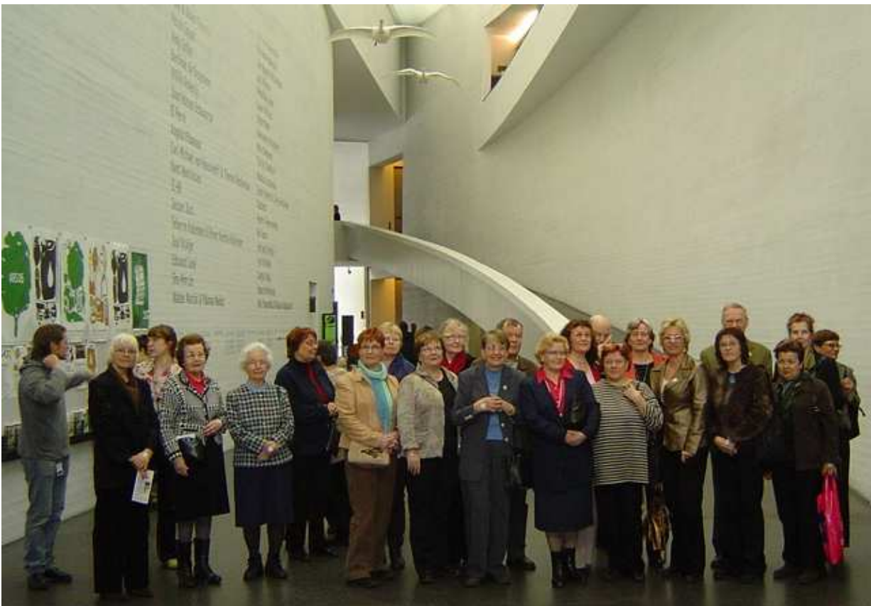
Sunnuntaimaalarit koolla menossa Kiasmaan.