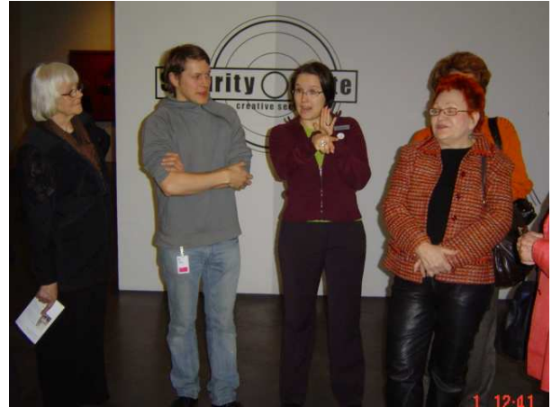
keskellä oppaamme Sunnuntaimaalareiden ympäröiminä

Taiteilijapari Muntean/Rosenblum kuvaa suurikokoisissa maalauksissaan nuoria ihmisiä muotilehdistä tai klassisista maalauksista muistuttavissa poseerauksissa. Taiteilijat ovat kertoneet haluavansa koskettaa ja liikuttaa katsojaa. Katsoja ei kuitenkaan ole varma tuntemuksistaan tai siitä, mistä ne ylipäättään syntyivät. Muntean/Rosenblum eivät halua välittää teoksillaan mitään konkreettista viestiä, vaan pitää ovet avoinna erilaisten tulkintojen ja väärinkäsitysten mahdollisuuksille.